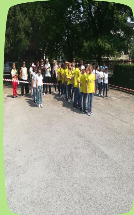
SALUTO ALLE QUINTE