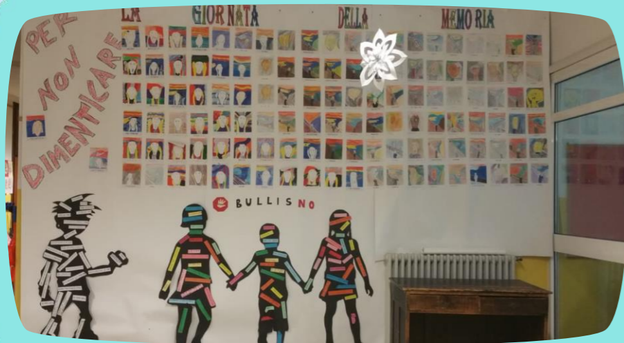
GIORNATA DELLA MEMORIA