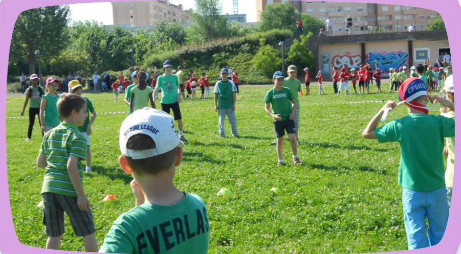
GIOCHI DI FINE ANNO