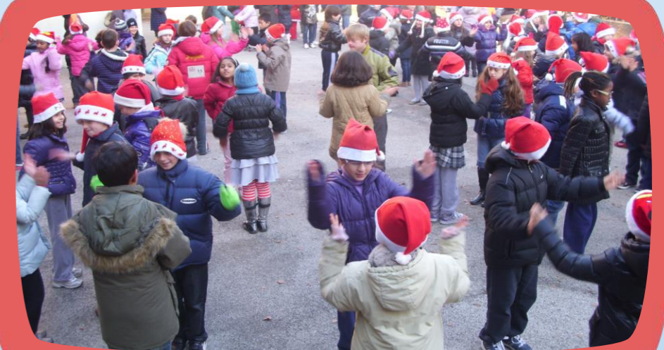
FESTA DI NATALE

Le insegnanti sono sempre disponibili a valutare proposte utili ad arricchire l'offerta formativa o a migliorare la qualità della scuola