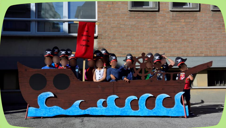
ACCOGLIENZA CLASSI PRIME